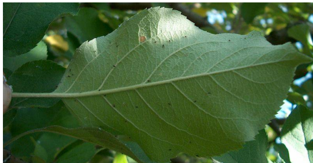
Illustration 4: adultes d' Aphelinus mali