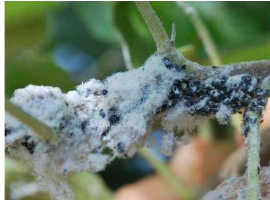
Illustration 3: pucerons parasités

Evaluation du risque : Période de risque en cours. A surveiller.