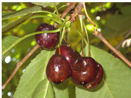
Illustration 7: Dégâts de Drosophila suzukii