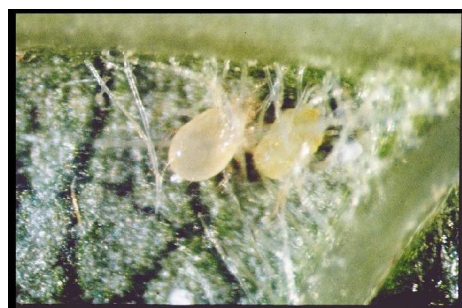
Illustration 10 : phytoséides

Seuil de nuisibilité : 50% des feuilles de rosette occupées par au moins une forme mobile.