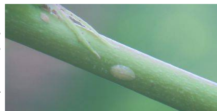
Illustration 5: cochenille lécanine

Évaluation du risque : Essaimage en cours, période à fort risque.