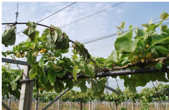
Illustrat° 9 : dégâts de Pseudomonas (psa) sur canne