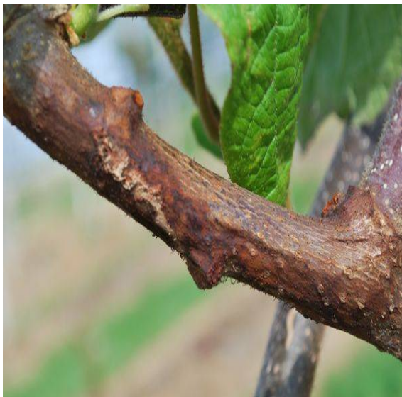
Illustration 8 : chancre sur bois

Vous pouvez consulter le site de la DRAAF pour des informations complémentaires : http://draaf.midi-pyrenees.agriculture.gouv.fr .