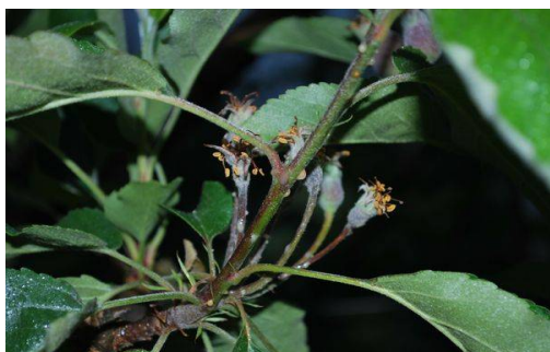
Illustrat° 1: feu bactérien sur Gala avec exsudat

La situation semble quelque peu se calmer avec moins de nouveaux symptômes. Rappelons que le feu bactérien est un parasite de quarantaine dont la présence doit être signalée au SRAL.