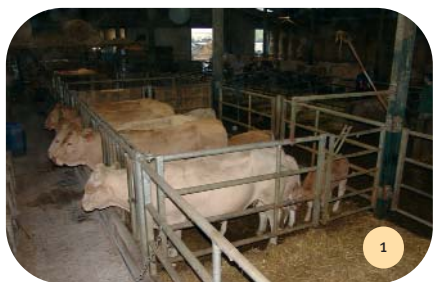
Vue intérieure du bâtiment.