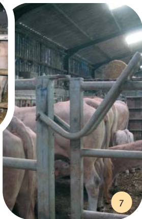
Système de fermeture rapide des cases.

Des cases à veaux sont disposées en alternance avec des aires de tétée. Les veaux sont lâchés case par case dans chacun de ces espaces clos et autonomes et tètent librement. Deux services de tétée sont nécessaires par module (aire de tétée 5 places entre 2 cases à veaux de 5 places chacune) : un pour la case de droite et un pour celle de gauche.