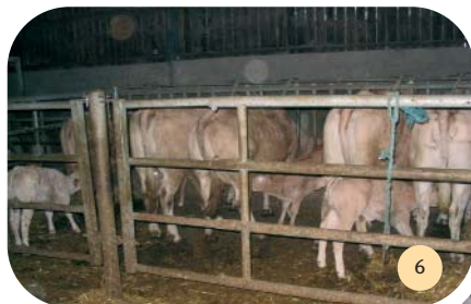
Des veaux à la tétée sur l'une des aires modulaires.

Le dispositif de tétée compartimentée est utilisable pour des troupeaux de taille conséquente (à partir de 50 vaches) avec réalisation de la tétée par une personne seule.