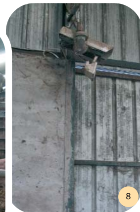
Caméra pivotante installée au fond de la stabulation libre.