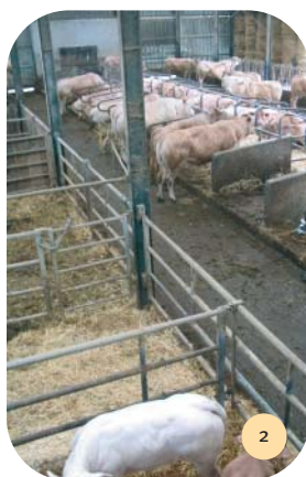
Vue des aménagements et équipements intérieurs.