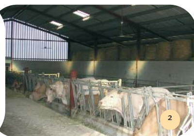
Couloir central avec 30 places pour les vaches à gauche et 30 places pour le box à veaux, les génisses et l'engraissement à droite.