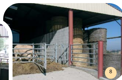
Un jeu de barrières permet un embarquement sans risque.