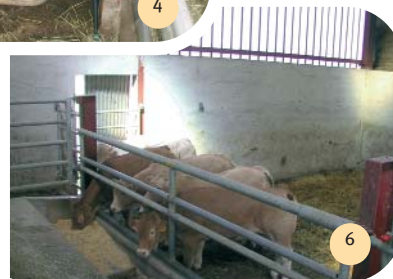
Box à veaux.