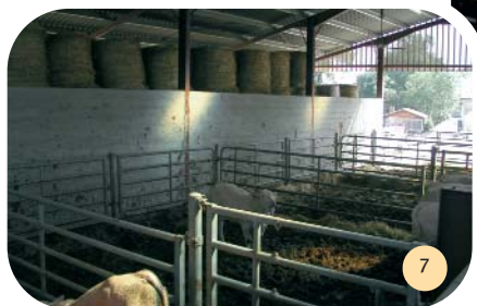
Un couloir de circulation longe tous les box depuis le parc à veau vers le quai d'embarquement.