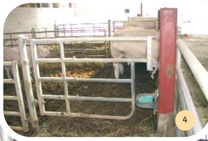
Trottoir autonettoyant et abreuvoir accessible depuis les 2 box.