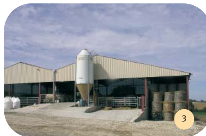
Adaptation à la pente du terrain (environ 10 %)...