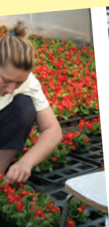
ssi un projet de

Le Point Info Installation c'est aussi la porte d'entrée pour accéder aux aides nationales à l'installation.