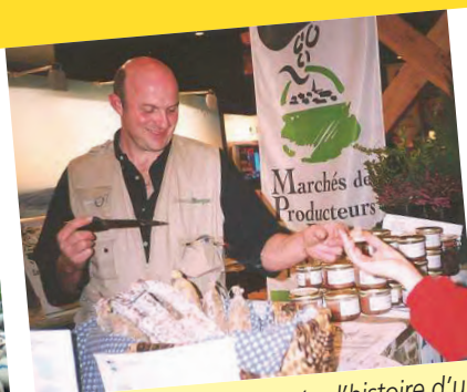
Qui de mieux pour raconter l'histoire d'un produit que le producteur lui-même?