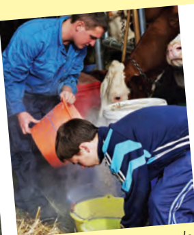
Aimer et prodiguer des soins aux animaux.