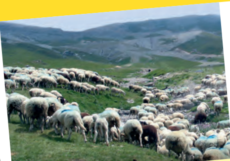
L'agriculture a aussi sa place en montagne !