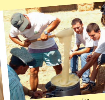
Les manifestations agricoles remportent toujours un vif succès !