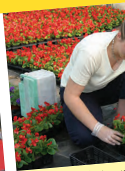
L'agriculture c'est aussi une femme !