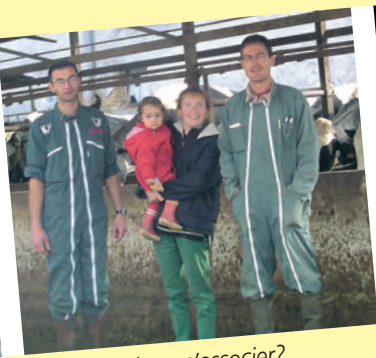
Et pourquoi pas s'associer?