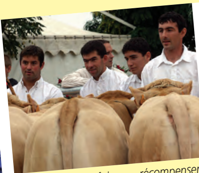
Les concours, les foires ... récompensent un savoir-faire !